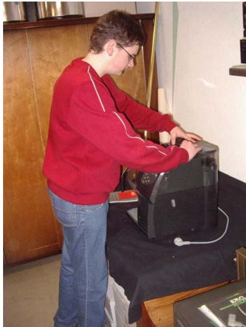
Schülerfirma MehrWert in Gelsenkirchen-Hassel: Versandvorbereitung

Ein zweites MehrWert -Projekt wurde nach den Sommerferien auch an der Förderschule Uhlenbrockstr. im Rahmen des Unterrichts mit zwei betreuenden Lehrern begonnen. Zwei Honorarkräfte leisteten die Starthilfe.