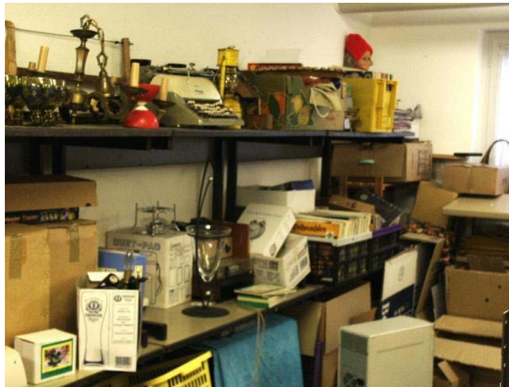
Blick in das Warenlager der Schülerfirma MehrWert in Gelsenkirchen-Hassel

(Bericht des Verantwortlichen für das Marketing)