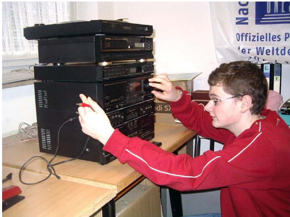
Schülerfirma MehrWert in Gelsenkirchen-Hassel: Prüfung auf Funktionstüchtigkeit

Ist die Auktion beendet, sollte eine Bewertung über den Käufer abgegeben werden. Diese ist dann für spätere Verkäufe an den gleichen Käufern und für andere Verkäufer hilfreich.