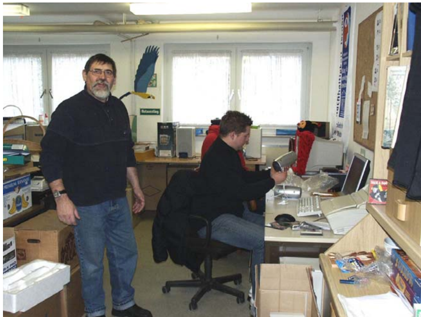
Blick in das Büro der Schülerfirma MehrWert in Gelsenkirchen-Hassel