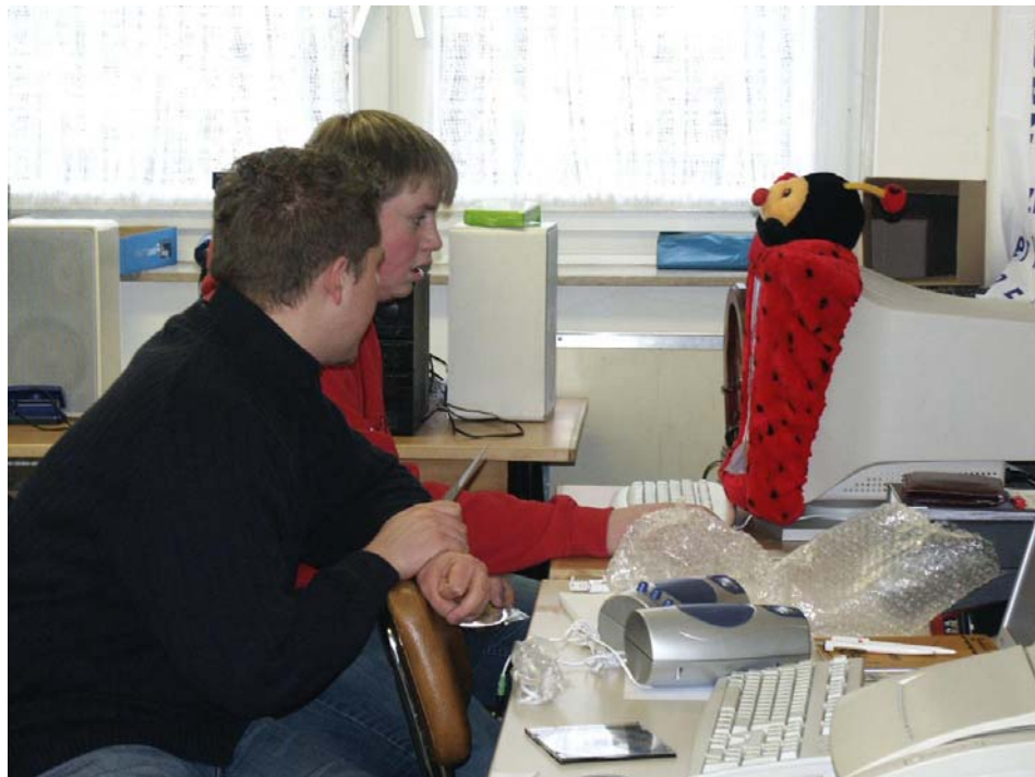
Schülerfirma MehrWert in Gelsenkirchen-Hassel: Datenverarbeitung

Der Sitz der Firma ist sinnvollerweise die Adresse der Schule mit dem Namen der Firma, der Straße, Hausnummer Postleitzahl und dem Ort.