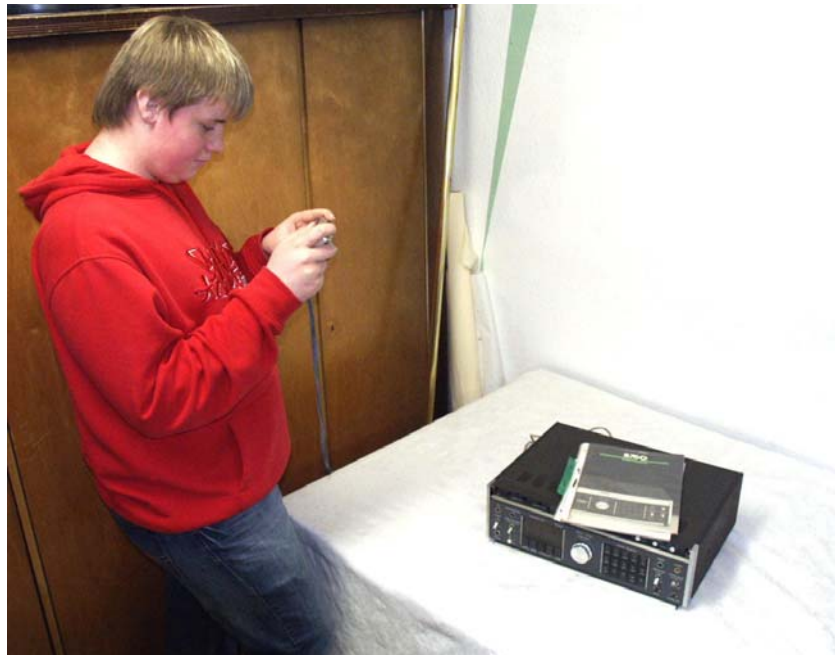
Fotoecke der Schülerfirma MehrWert in Gelsenkirchen-Hassel

An der Schule sollte ein "schwarzes Brett" genutzt werden, um über die Firma zu informieren: Was gilt es beim Einsammeln von Artikel zu beachten, welche Erfahrungen wurden gemacht, welche Ratschläge gibt es? Außerdem kann dort der letzte Geschäftsbericht ausgehängt werden. Zusätzlich sollten regelmäßig Artikel in der Schülerzeitung veröffentlicht werden. Möglich ist auch eine Informationsveranstaltung in der Aula.