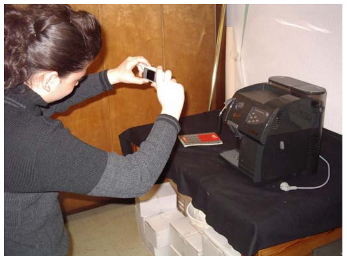
Schülerfirma MehrWert in Gelsenkirchen-Hassel: Artikelfoto

MehrWert wurde auch erfolgreich umgesetzt am Berufskolleg für Wirtschaft und Verwaltung in Gelsenkirchen.