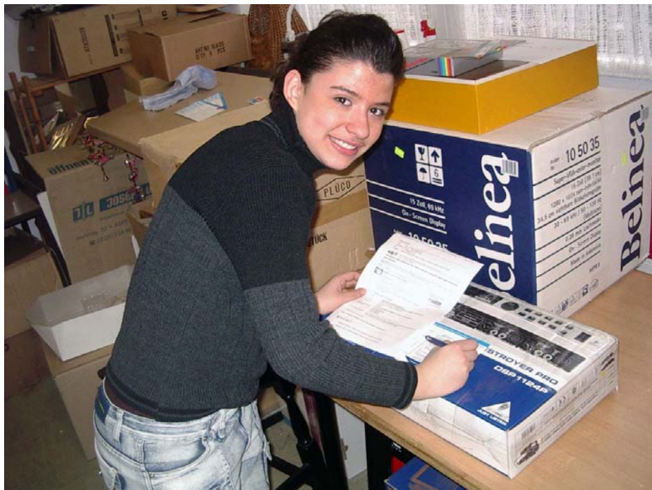
Versandabteilung der Schülerfirma MehrWert in Gelsenkirchen-Hassel

Ein wirkliches Konkurrenzverhältnis ist jedoch in der Regel nicht gegeben: Der professionelle Händler verkauft – als Weiterverkäufer eher hochpreisige Artikel; die Schülerfirma hingegen meistens Produkte, die für den professionellen Verkäufer recht uninteressant sind. Die "Profis" bewegen sich in einer ganz anderen Größenordnung bezüglich der Verkaufspreise und Mengen. Die Spendenden trennen sich von Artikeln, die sie so nicht verkauft hätten, denn sonst würden sie sich nicht von ihnen trennen.