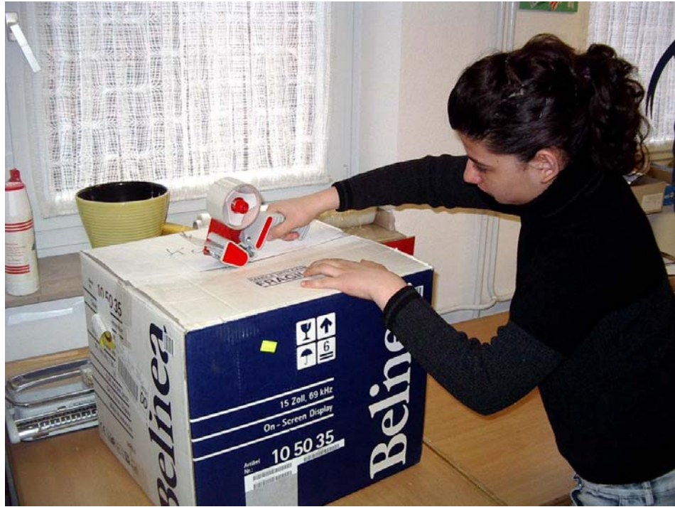
Versandabteilung der Schülerfirma MehrWert in Gelsenkirchen-Hassel